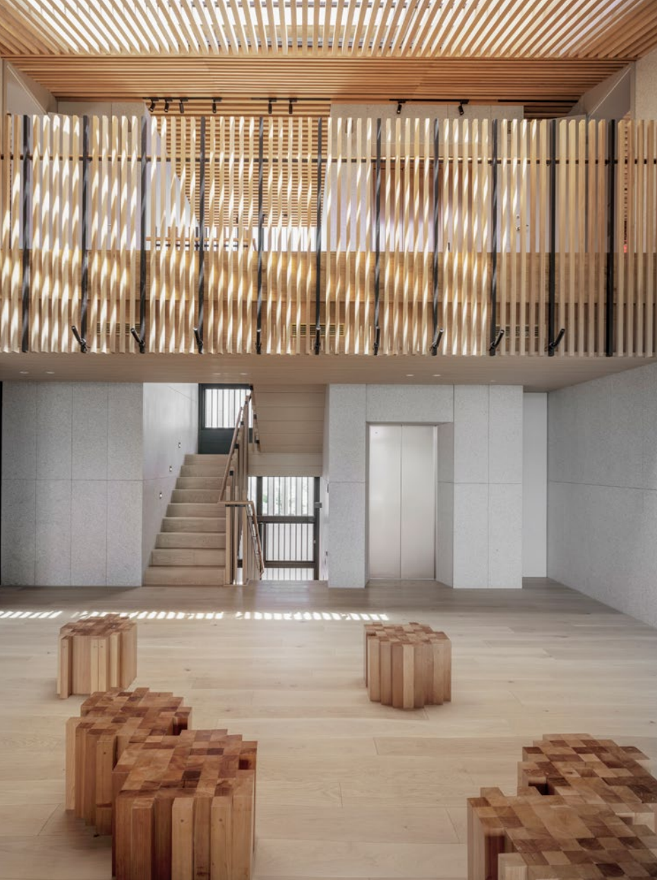
自左圖順時針方向起：二樓寬敞挑高的大客廳望向樓梯間；大客廳可一覽周邊環境的寬廣騎樓，天花則是沿著屋脊曲面所構築的格柵；屋頂上能輕易眺望澎湖極致美景；臥室壁面捨棄會剝落發霉的水泥粉光，改為耐用美觀的實木和珪藻土。