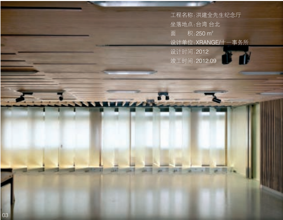
工程名称: 洪建全先生纪念厅 坐落地点: 台湾 台北 面 积: 250 m 2 设计单位: XRANGE/十一事务所 设计时间: 2012 竣工时间: 2012.09