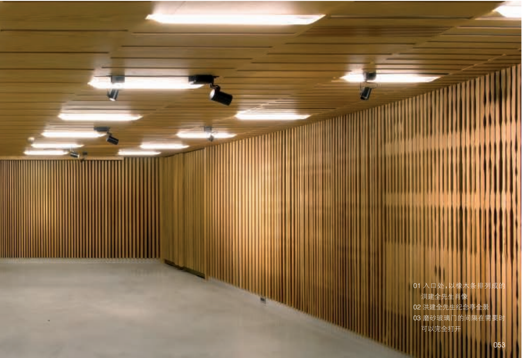
01 入口处,以橡木条排列成的 洪建全先生肖像 02 洪建全先生纪念亭全景 03 磨砂玻璃门的间隔在需要时 可以完全打开